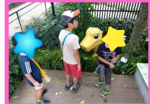
24日(木)東映アニメーション