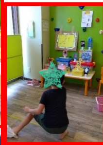
10日(水) 団扇づくり 夏まつり