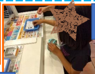
2日(火) かざぐるま作